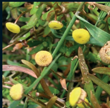
Botón de oro Cotula coronopifolia L. Sur de África