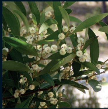
Acacia negra Acacia melanoxylon R. Br Sudeste de Australia y Tasmania