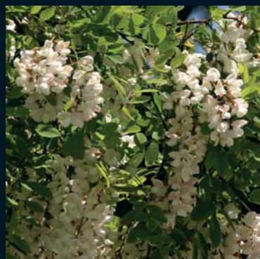
Falsa acacia Robinia pseudoacacia L. Centro y Este de EE.UU.