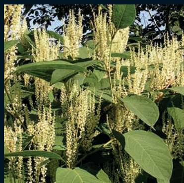
Polígono japonés Reynoutria japonica Houtt. Japón