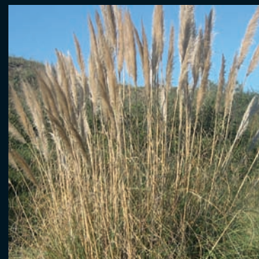
Plumero Cortaderia selloana (Schult. & Schult. f.) Asch. & Graebn. Sudamérica