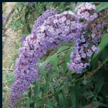
Budleya Buddleja davidii Franch. China