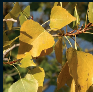
Álamo negro Populus nigra L. Este de Europa y oeste de Asia