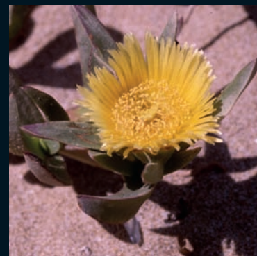
Uña de gato Carpobrotus edulis (L.) N. E. Br. Sudáfrica