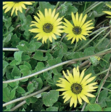
Margarita africana Arctotheca calendula (L.) Levyns Sudáfrica