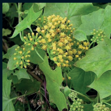
Senecio oloroso Senecio mikanioides Otto ex Walp. Sudáfrica