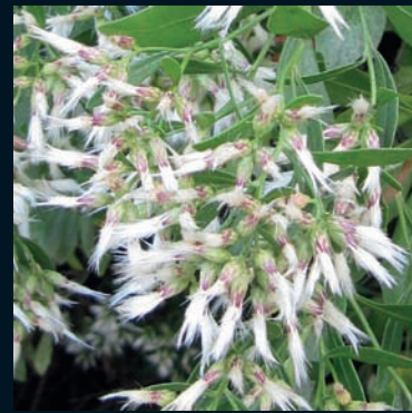
Bácaris Baccharis halimifolia L. Este de Norteamérica