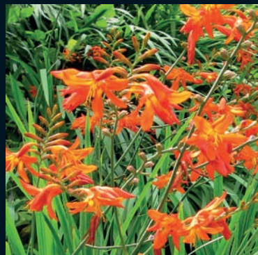
Crocsmia Crocsmia x crocosmiiflora (Lemoine) N. E. Br. Sudáfrica