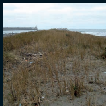
Espartina Spartina versicolor Fabre Este de Norteamérica