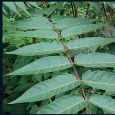
Ailanto Ailanthus altissima (Mill.) Swingle China