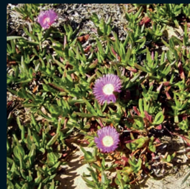
Uña de gato Carpobrotus acinaciformis (L.) L. Bolus. Sudáfrica