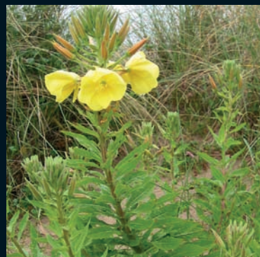
Hierba del asno Oenothera glazioviana Micheli Norteamérica