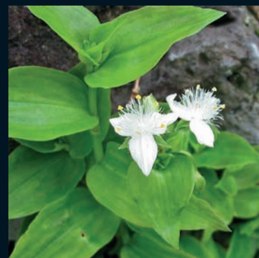
Amor de hombre Tradescantia fluminensis Vell. Este de Sudamérica