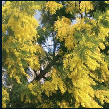
Mimosa Acacia dealbata Link Sudeste de Australia y Tasmania