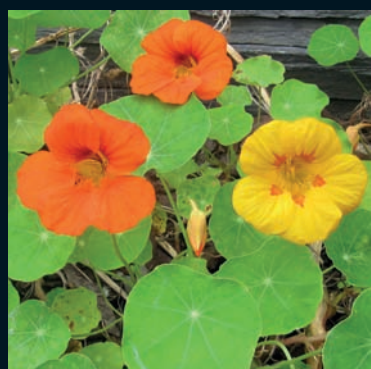
Capuchina Tropaeolum majus L. Sudamérica