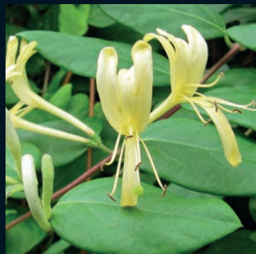
Madreselva olorosa Lonicera japonica Thunb. Este de Asia